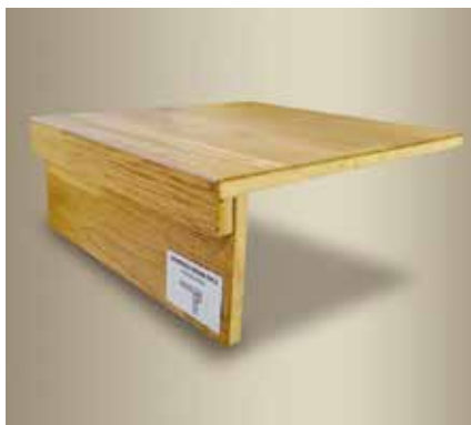
Typ D – boční lišty