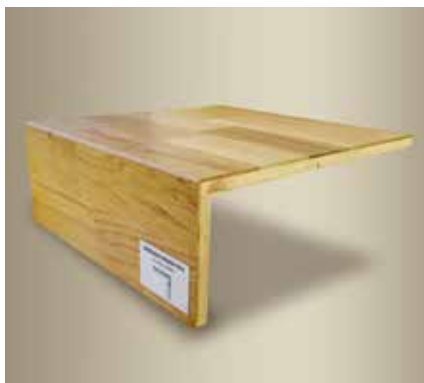
Typ C – boční lišty